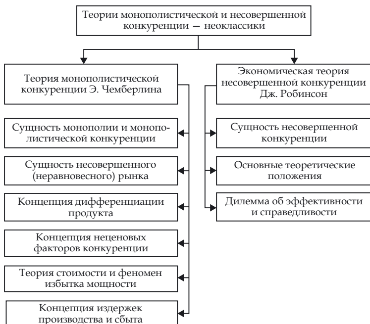
Рис. 3. Теории рынка с несовершенной конкуренцией

Итак, в 1933 г. на противоположных берегах Атлантики американец Э. Чемберлин и англичанка Дж. Робинсон издали свои книги, назвав их соответственно «Теория монополистической конкуренции» и «Экономическая теория несовершенной конкуренции» (рис. 3).