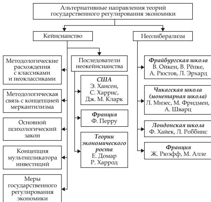
Рис. 4. Кейнсианские и неолиберальные теории государственного регулирования экономики

но являются мелкими и выступают на каждом рынке, стал несостоятельным», поскольку «неравенство, возникающее в результате существования монополии и олигополии, распространяется на сравнительно узкий круг людей и в силу этого в принципе может быть исправлено вмешательством государства» [2, с. 40, 43].