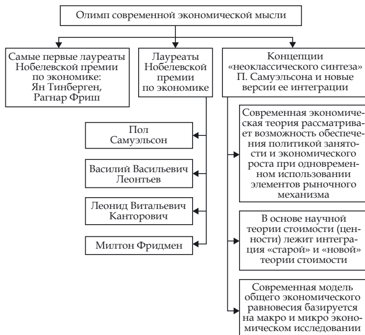
Рис. 5. Нобелевские лауреаты по экономике — Олимп современной экономической науки

Первыми лауреатами Нобелевской премии по экономике в 1969 г. стали два экономиста-математика — голландец Ян Тинберген и норвежец Рагнар Фриш, заслугой которых признана разработка математических методов анализа экономических процессов (рис. 5).