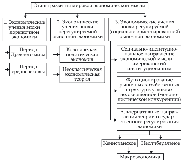
Рис. 1. Этапы (эпохи) развития мировой экономической мысли

Одновременно следует отметить, что во временном аспекте эволюцию мировой экономической мысли от возникновения в экономической науке ортодоксальных начал и до их преодоления (от ортодоксии классической политической экономии и вплоть до преодоления в XX столетии ортодоксальных начал в этой отрасли человеческих знаний) целесообразно рассматривать через призму трех эпох. Это: 1) эпоха дорыночной экономики; 2) эпоха нерегулируемой рыночной экономики; 3) эпоха регулируемой (социально ориентированной) рыночной экономики (рис. 1).