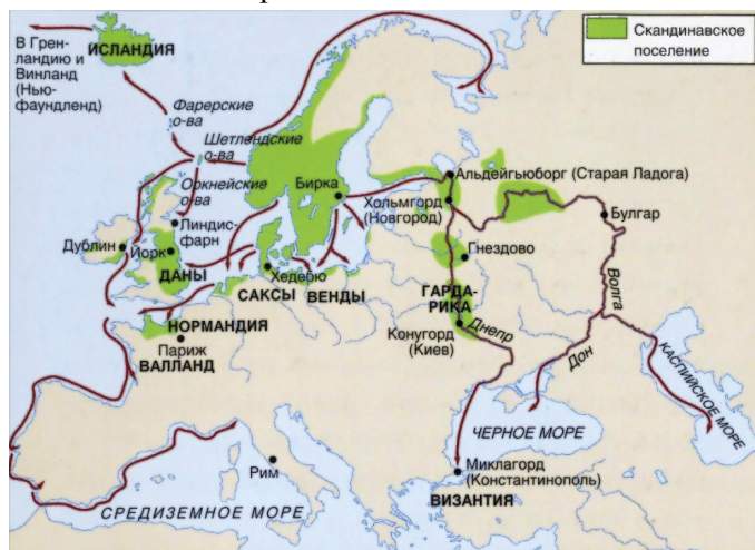
Рис. 1. Торговые пути викингов

Дальние экспедиции викингов требовали совершенно другой организации, чем короткие налеты. Требовалось объединение отрядов, каждый из которых начинал зимовать в странах, где собирался «поохотиться». С 835 г. скандинавы начинают зимовать в Ирландии, с 843 г. — в Галлии, с 851 г. — в Англии. Эти разбойничьи гнезда стали постепенно и местами торгова с местными жителями. Возникает сеть укрепленных рынков вокруг Балтики. Так бок о бок с военным делом развивалась и торговля (рис. 1). Не случайно в северо-западной России вплоть до XIX в. варягами называли мелких торговцев.