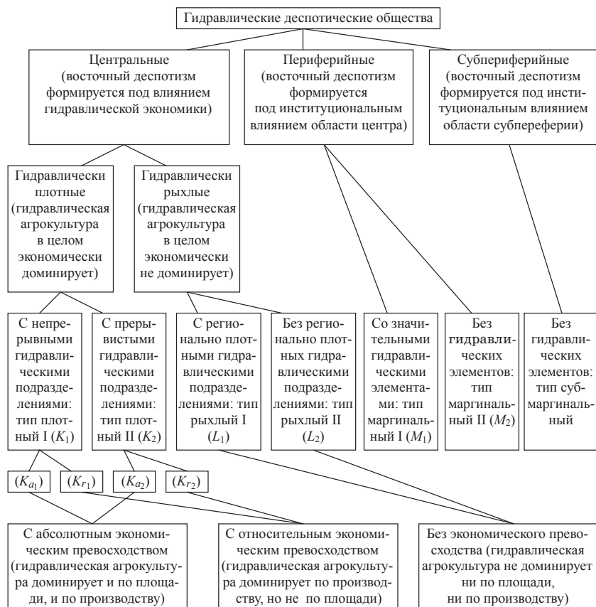
Рис. 3. Типология «гидравлических обществ», по К.А. Виттфогелю

Далее Виттфогель прослеживает развитие отношений собственности в тесной взаимосвязи с эволюцией государственной структуры. «Аграрное аппаратное государство... обладало монополией на все строительные работы монументального стиля... Вследствие этого основанное на частной собственности и независимое ремесло не имело никаких шансов пробиться в самый важный сектор гидравлической промышленности... Возможнос-