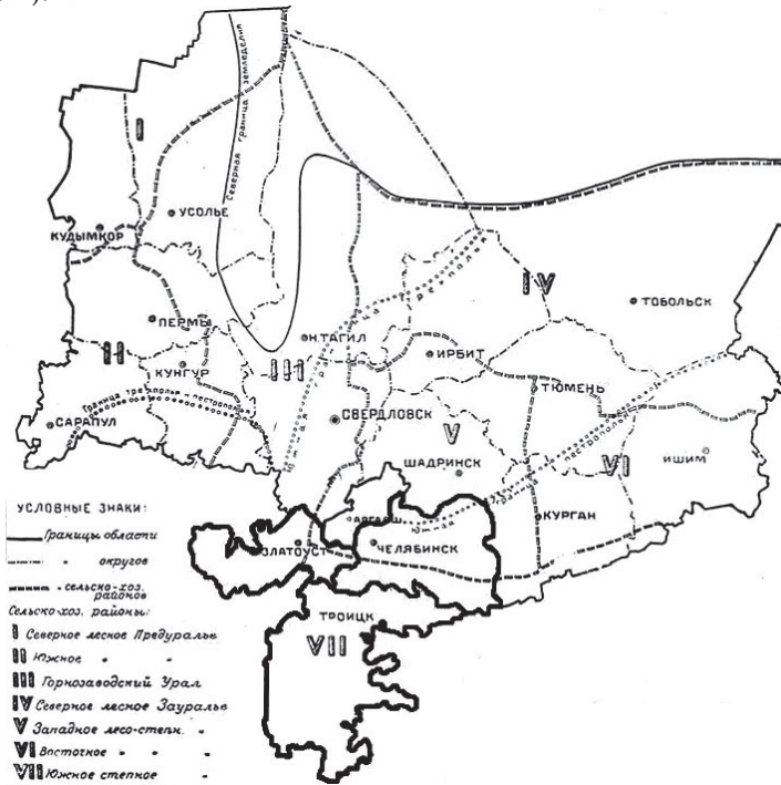
Рис. 2. Карта сельскохозяйственных районов Уральской области на 1929 г. 33

Формируемую ими территорию можно рассмотреть на карте (рис. 2).