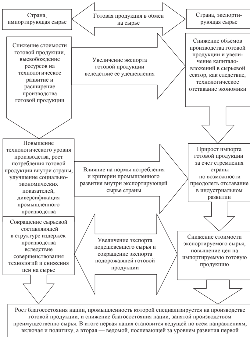
Рис. 2. Подъем и упадок наций как следствие специализации в мировой торговле

Выводы, приводимые в схеме, подтверждаются также статистикой динамики изменения структуры мирового экспорта в